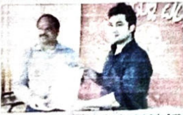
ಮಂಗಳೂರಿನಲ್ಲಿ ಇಸ್ರೇ ಅಂಗಸಂಸ್ಥೆ ಸಹಭಾಗಿತ್ವ... ಉಪಗ್ರಹ ನಕಾಶೆ ಯೋಜನೆ ವಿಸ್ತರಣೆ... ಇಸ್ರೇ ಅಂಗಸಂಸ್ಥೆ ಸಹಭಾಗಿತ್ವ... ಮಂಗಳೂರು ವರದಿ ಜಿಪಂಗಿ ಹೆಸಾಂತರ...